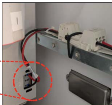
Figura 2 - Vedere extinsă a cablului de alimentare Iris potențial afectat